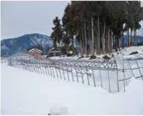
未被覆期間に倒壊した育苗ハウス