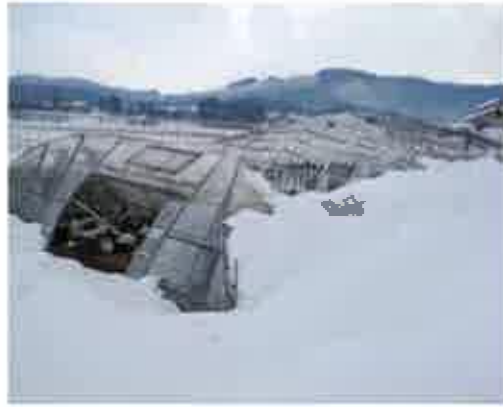
雪害によって倒壊したハウス